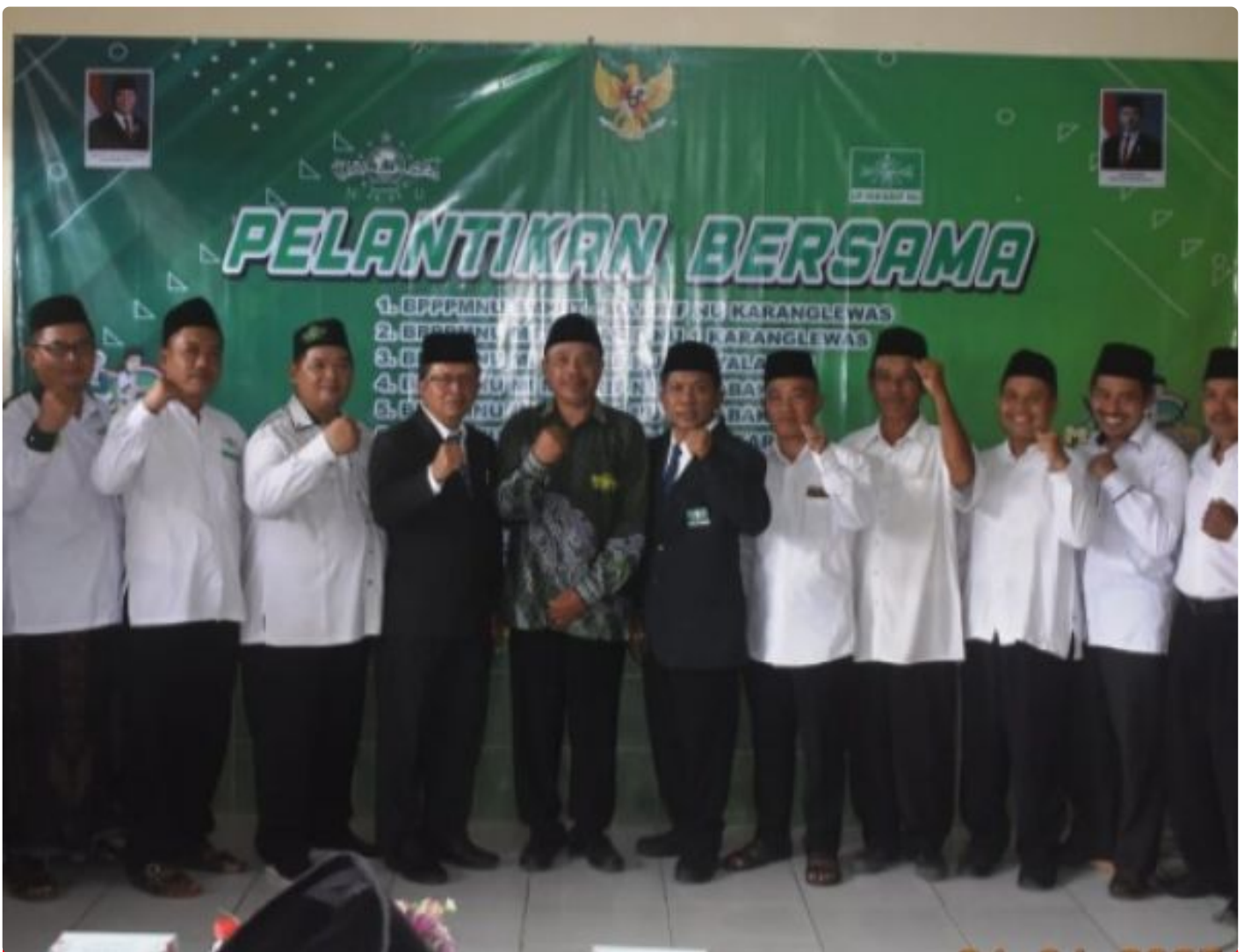
Pelantikan masal BP3MNU 11 Madrasah di Kecamatan Karanglewas 2024 - 2029

KARANGLEWAS - Bukan hanya khitan masal atau pernikahan masal, LP Ma'arif Kecamatan Karanglewas juga Laksanakan Pelantikan dan pengambilan sumpah Masal para Ketua bersama pengurus dalam Mengawali masa khidmah tahun 2024 - 2029 untuk 11 Badan Penyelenggara Pendidikan Pengembangan Ma'arif